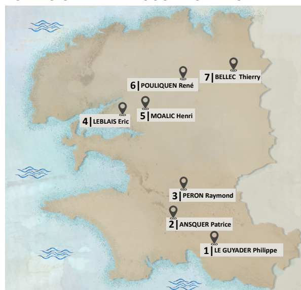
LISTE DES CONDUCTEURS DE CHIENS DE SANG DU FINISTÈRE