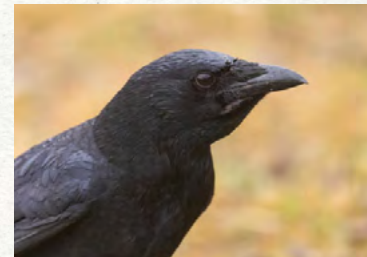
Finistère : déclaration de dégâts sur cultures/animaux/matériel - PAPIER