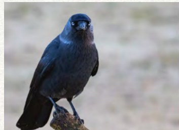
Finistère : déclaration de dégâts sur cultures/animaux/matériel - EN LIGNE