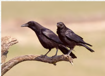
Finistère - demande individuelle pour la destruction à tir ESOD - 2023

! Ce formulaire ne donne pas droit à indemnisation mais nous permet d'établir des dossiers pour la meilleure prise en compte des dégâts de la faune sauvage dans les procédures de gestion.