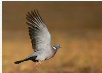
Finistère : bilan individuel de destruction a tir des ESOD - saison 2023